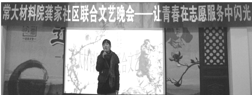
材料学院志愿者与常州龚家社区举办联合文艺晚会

后,全国掀起了一股志愿活动的热潮,我们抓住机遇,大胆创新,一步一步将我们的志愿者团做大做强。”正是秉持这一理念,志愿者团成员大胆开动