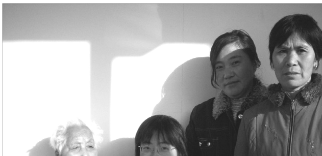
材料系爱心社志愿者赴常州夕阳红敬老院慰问孤寡老人

——爱心社，标志着材料系在武进校区的志愿服务正式开启。材料系爱心社志愿者开始不定期到武进区夕阳红敬老院等机构开展志愿服务活动。