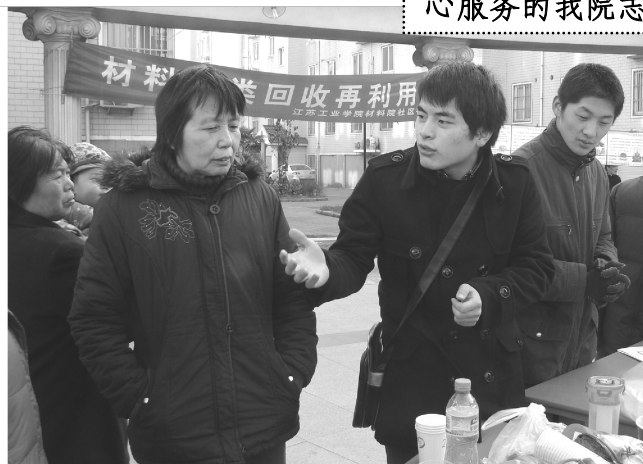
材料学院志愿者开展材料分类回收再利用进社区活动

制了风格独特的红马甲。从此,印有“常州大学材料学院青年志愿者”标志的红马甲,出现在了常州天爱儿童康复中心、常州聋人学校、武进长安社区、湖塘乐购广场等各类场所,火红的爱心和热情传递给了自闭症儿童、聋哑学生、孤寡老人乃至普通的路人。