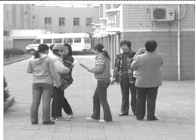
材料系爱心社志愿者在湖塘镇古方社区开展防火防盗义务宣传

05 级学生入学后，材料系学生的主体逐渐倾移至武进校区。系爱心社的志愿者队伍不断壮大，陆续与湖塘镇古方社区、降子社区、武进特殊学