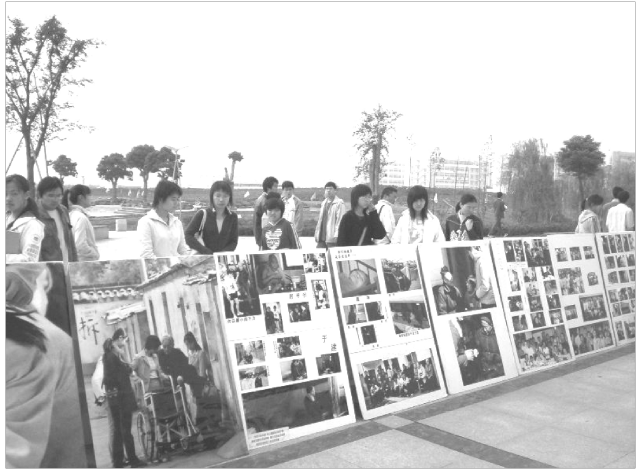
材料系爱心社联合常州一加爱心社在武进校区开展志愿服务宣传活动

2004 年，随着 04 级学生的到来，武进校区逐渐热闹起来，在此基础上，材料系在武进区的志愿服务冒出了点点星火。我系联合政法系（现文法学院）一同与常州“一加”爱心社合作成立了自己的公益团体——