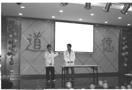
11 级学生中也有不少具有表演天赋的