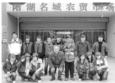
积极参加社区共建活动，加强与社会的联系