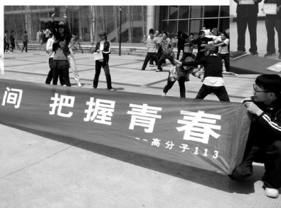
各班的主题团日活动开展得风风火火