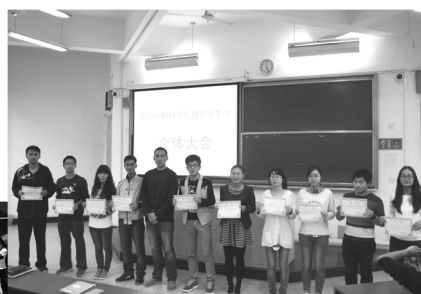
许多11级的同学已经成为学校、学院各类学生社团的骨干