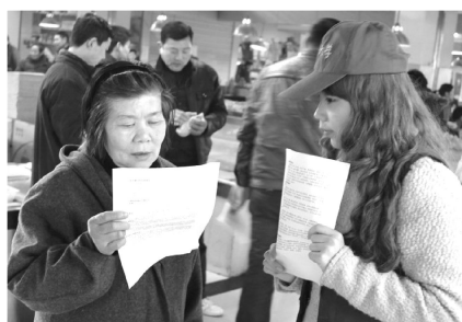
大一时许多11级同学满怀热情投身志愿服务工作